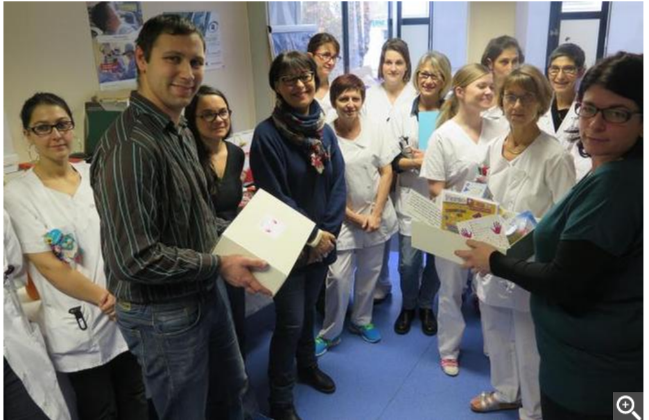
Du matériel destiné aux tout-petits et à leurs parents, pour améliorer leur hospitalisation, a été remis au service de chirurgie viscérale de Clocheville.

En 2016, L.E.O.N.O.R.E va poursuivre ses actions (brocantes, loto...) afin de financer l'hébergement des parents au sein de la Maison des familles et de participer au frais de déplacement. « Nous aimerions développer les aides sociales. Nos réfléchissons aussi à la possibilité de faire appel à une baby-sitter pour prendre en charge les enfants des fratries et permettre aux deux parents de passer du temps avec l'enfant hospitalisé. »